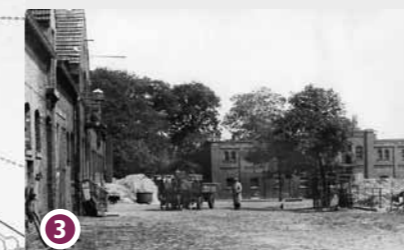
Landwirtschaftsgebäude, 1930er Jahre