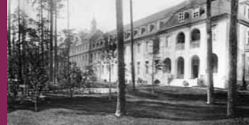
Das Krankenhausgelände um 1920