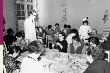
Arbeitstherapie in Haus 6 um 1970