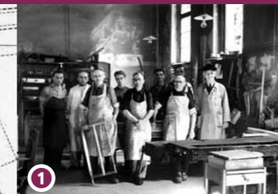
Therapie in der Tischlerei, 1952