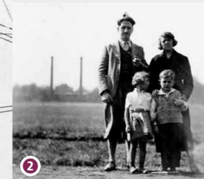
Feld hinterm Kesselhaus, um 1935